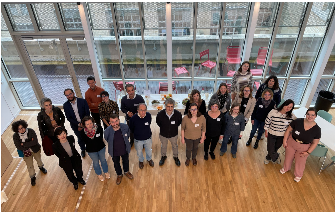
Première journée des correspondantes et correspondants communication de l'Insmi