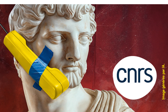
Image générée par IA.

En 2022, l'Insmi a initié une réflexion sur la place des mathématiques dans la société. Ce projet inédit, dénommé « Assises des mathématiques », avait pour objectif de dresser un état des lieux, d'identifier les faiblesses et de proposer des améliorations , grâce à des témoignages d'industriels, de scientifiques d'autres disciplines, de représentants de la société civile ou encore de personnalités politiques. Aujourd'hui, nous souhaitons étendre cette réflexion auprès du grand public, des citoyennes et des citoyens .